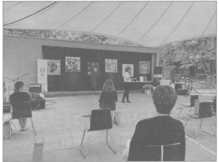
Auf Abstand und trotzdem für demokratische Überzeugungen ganz nah!