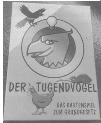
Spannendes Spiel mit Lerneffekten! Der Bundesadler als Tugendvogel!

Jetzt auch in Heilbronn! „Demokratie feiern!“ - das 10. Regionale Demokratiezentrum des Landes wurde am vergangenen Samstag auf dem Gaffenberg mit einem Festakt in den Fokus gerückt! Unter den bestehenden Corona-Bedingungen perfekt organisiert, waren es vor allem junge Menschen aktiv, die mit Band, Gesang, Poetry Slam und Begeisterung unter Beweis stellten, wie wichtig es ihnen ist, nicht nur in einer Demokratie zu leben, sondern diese auch zu beleben und aktiv mitzugestalten, für Demokratie einzutreten und diese zu verteidigen.